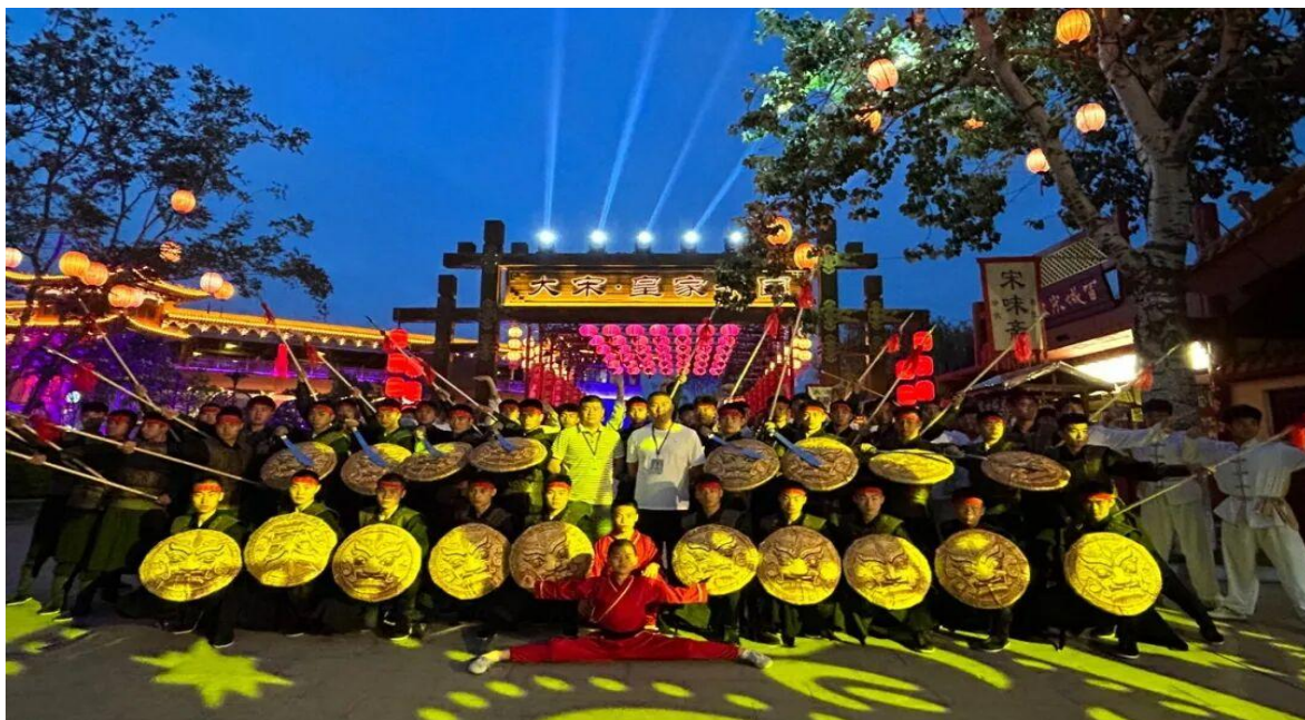
图 13 参与《锦绣山河》节目演出

伴随着激昂的戏曲鼓点与悠扬的弦乐，鹅坡学子身着飒爽的武术服装，手持器械鱼贯登场。他们一招一式刚劲有力，行云流水，将少林武术的力与美、刚与柔展现得淋漓尽致。枪影翻飞时，似万马奔腾，展现出巍峨峰岭的雄浑壮阔；拳风呼啸间，如苍鹰搏空，勾勒出锦绣山河的磅礴气象，为现场观众奉献了一场震撼人心的视觉盛宴。