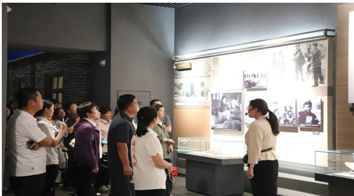
图 1 赴河南兰考焦裕禄纪念馆开展红色教育实践

6月6日，鹅坡中专党总支、工会联合组织优秀管理者及优秀教职工，赴河南兰考焦裕禄纪念馆开展红色教育实践活动，并前往山东菏泽曹州武校进行考察交流。通过实地参观学习，激励教职工以弘扬焦裕禄精神为动力，赋能新时代武术教育高质量发展。