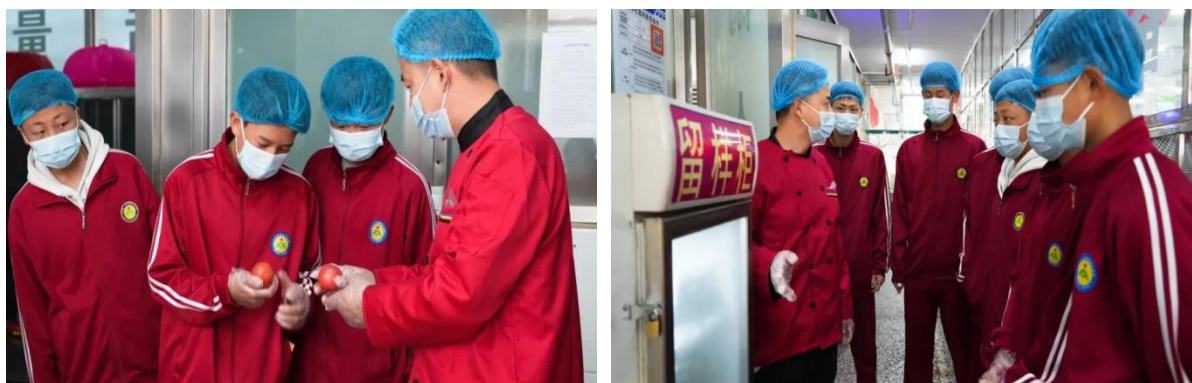
图 9 餐厅评议

度、食品储存条件、食材采购渠道及质量把控等情况，让学生代表直观地了解到餐厅食材的储存环境和安全保障措施。