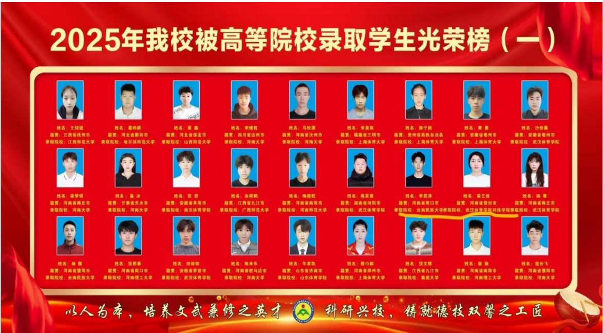
图 10 2025 年高等院校录取光荣榜

对口单招考试升学比例为 30.95%；对口升学考试（含对口单招招生）升学比例为 32.14%；普通高考体育类升学比例为 1.19%，普通高考录取升学比例为 0%。