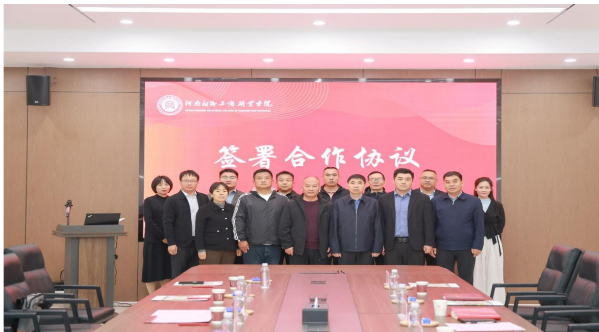
图7 与河南新乡工商职业学院合作签约仪式

为深化中高职衔接改革，10月9日与河南新乡工商职业学院正式签署合作协议，双方将整合优质教育资源，共建“中职筑基、高职赋能”的无缝衔接培养通道，通过课程共建、师资共享、实训协同等机制，实现“武术筑基”与“专业赋能”的有机融合，共同培育具备武术素养与专业技能的高素质复合型人才。