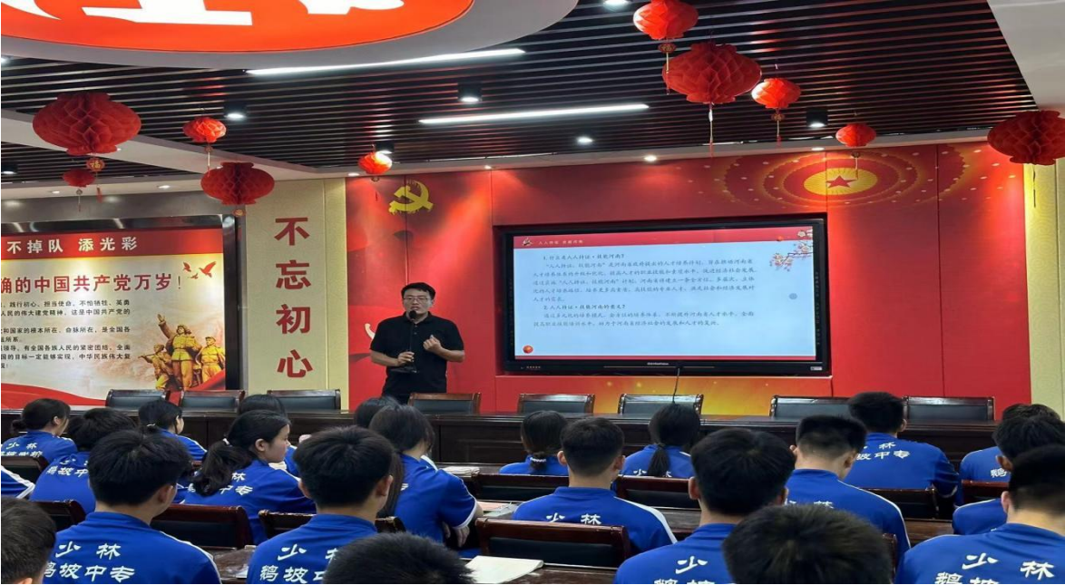
图 8 开展职业技能等级培训

上级部门关于职业技能培训工作的部署要求，聚焦学生职业能力提升，全年完成职业技能等级培训 840 人次。