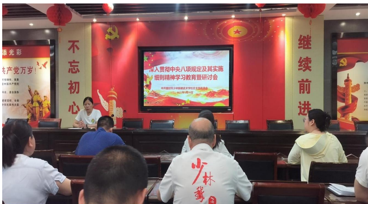
图 2 学校党员集中学习中央八项规定

（2）学校团组织在学校党支部的坚强领导下，深入贯彻落实习近平总书记关于青年工作的重要思想，坚定不移走中国特色社会主义发展道路，围绕立德树人根本任务，始终把加强对团员青年的政治引领摆在首位，聚焦“政治学校、先锋力量、桥梁纽带、先进组织”持续发力，围绕中心、服务大局，深化共青团改革创新，顶天立地、追求卓越，团结引领青年坚定不移听党话、跟党走。