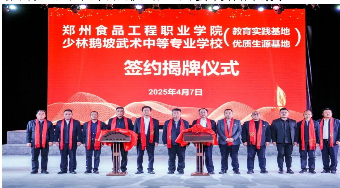
图 19 与郑州食品工程职业学院签约揭牌仪式

教学成果，为河南乃至国家争得了诸多荣誉，备受各界赞誉与尊敬。而郑州食品工程职业学院锚定打造食品类顶尖院校的目标，在食品领域精耕细作。此次战略合作，既是"中华武韵"与"华夏食韵"的深度融合，更是产教协同的创新实践。期待双方以此次合作为契机，在弘扬中华优秀传统文化、赋能产业发展中激发创新活力，让中华武术风靡世界，让健康美食香飘寰宇！