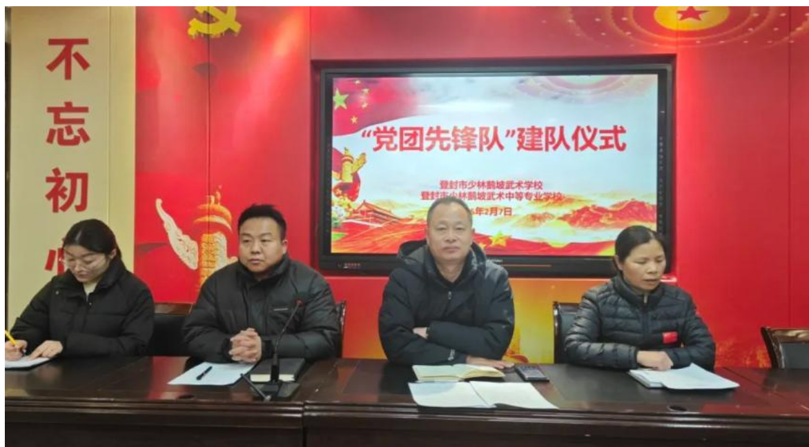
图4 “党团先锋队”建队仪式

务，大力弘扬志愿服务精神，积极传递正能量。通过系列活动的开展，增强队员的社会责任感与团队凝聚力，培养奉献意识和担当精神。同时，吸引更多师生关注并投身公益活动，让积极参与公益成为校园新风尚，推动校园精神文明建设迈向新高度。