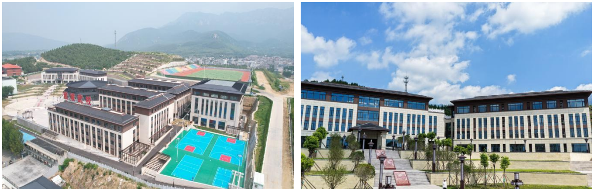
图 21 学校校园布局