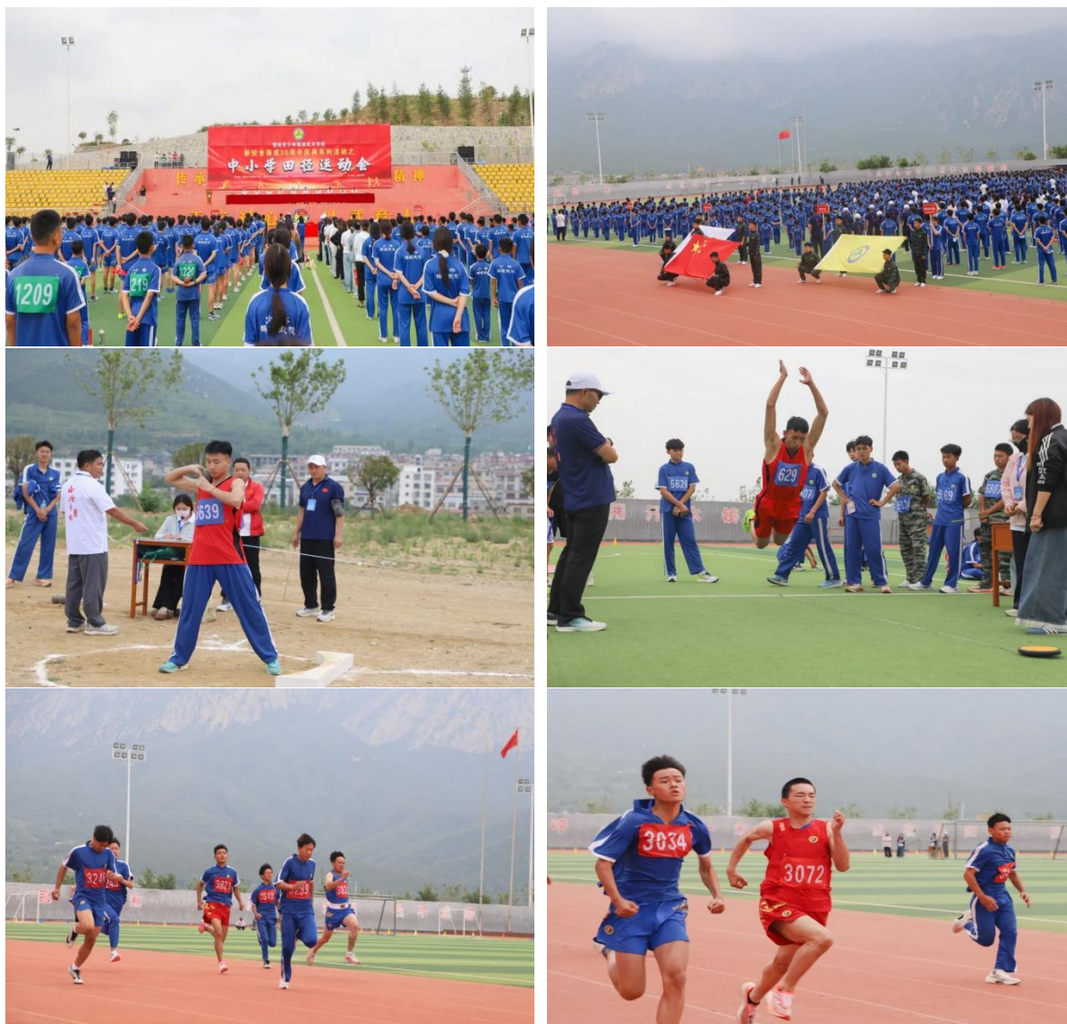
图 25 田径运动会