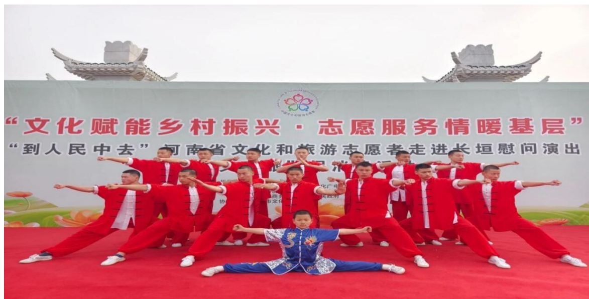
图 14 参加河南省文化和旅游志愿者走基层慰问演出

鹅坡学子带来的武术表演《少林雄风》成为全场焦点。拳术如雷霆乍惊，器械似游龙惊鸿，尤其是硬气功“周身开棍”的绝技，以血肉之躯震断木棍的瞬间，引爆了雷鸣般的喝彩。这群曾登上央视春晚、到国外出访的年轻人，此刻正以拳脚为笔，在乡村舞台书写新的使命——他们不仅是少林武术的传承者，更是将传统文化淬炼为乡村振兴力量的时代使者。