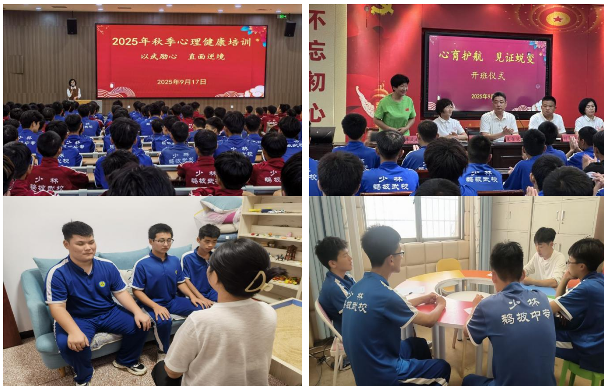
图 6 开展心理健康辅导

构建“预防—筛查—干预—跟踪”四位一体心理育人体系。完善“一生一策”心理档案，实施学期初、重大活动前、毕业季等关键节点动态排查。配齐专兼职心理教师，常态化开展团体辅导、个体咨询、心理讲座。将武术训练与情绪调节相结合，探索“动中修心、武中养性”的特色心育路径，近三年学生心理危机事件零发生，心理健康素养达标率稳步提升。