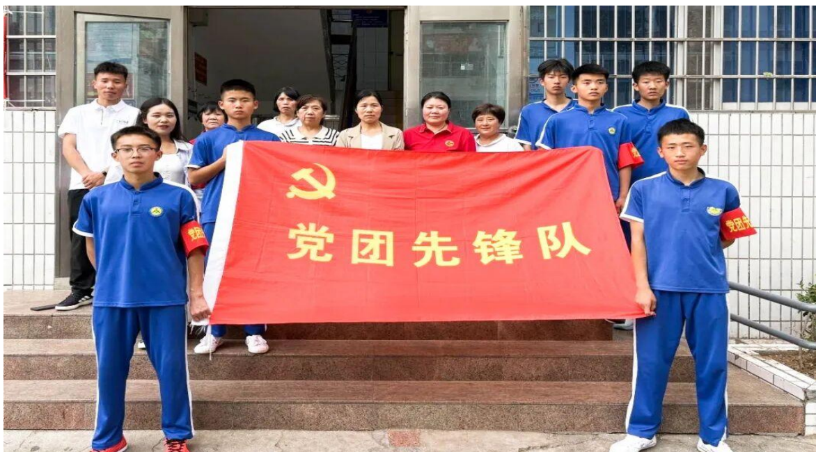
图 3 党团先锋队开展志愿服务