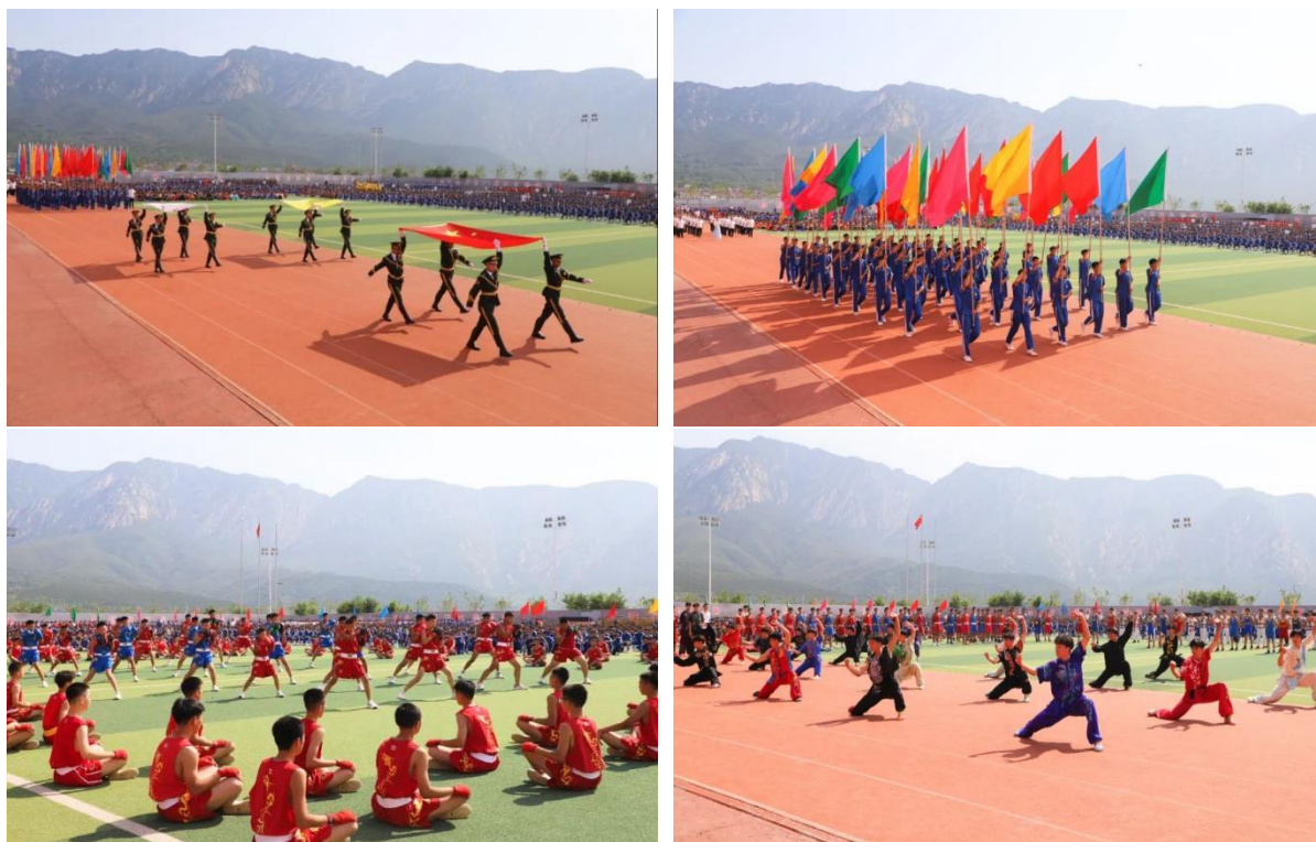
图 24 校运会