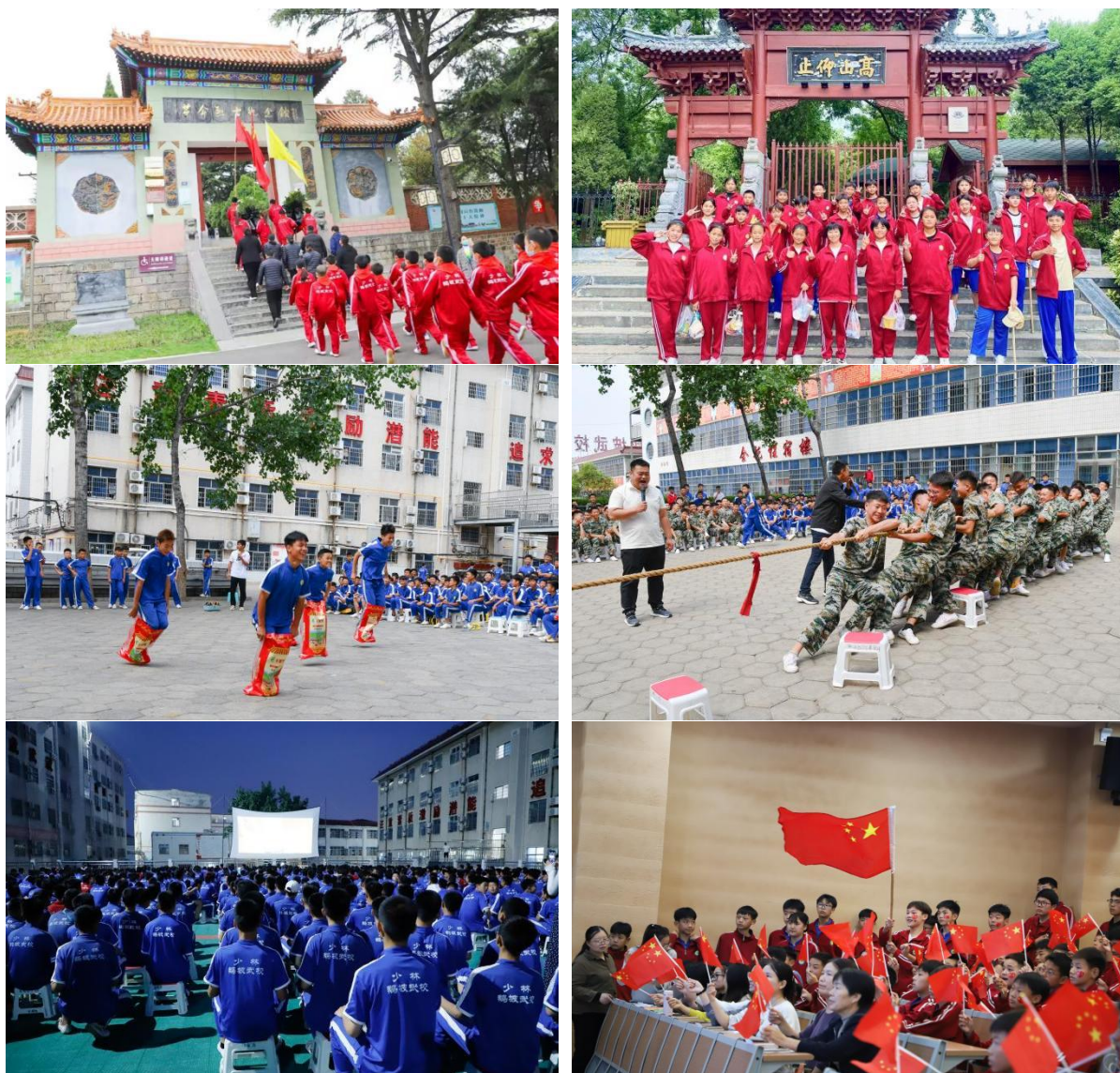
图 5 丰富多彩的文化活动

（2）校园文化育人。以中华优秀传统文化特别是少林武术文化为底色，打造特色校园文化生态。深化“鹅坡十美”品牌建设，引导学生明大德、守公德、严私德，树牢正确世界观、人生观、价值观。开展“最美学生”“武德标兵”“星级宿舍”等典型选树活动，发挥榜样示范效应。推行“勤俭节约·以俭修身”