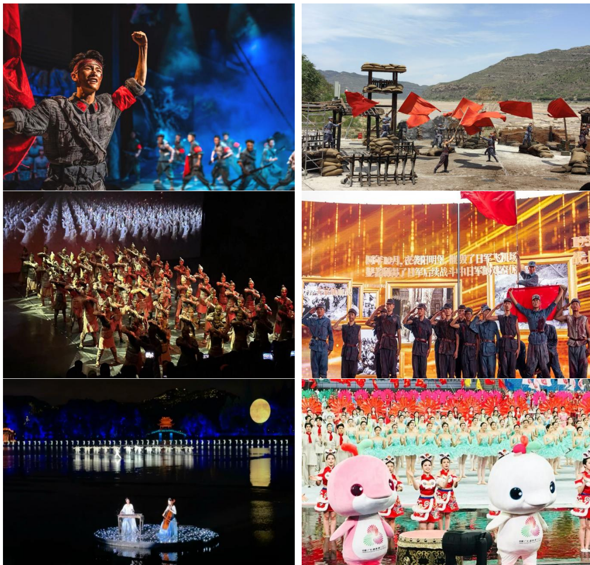
图 12 对外演出活动

(2) 学校安排学生到与登封市鹅坡禅武大酒店有限公司、新郑慧闻彩虹幼儿园、登封市少林鹅坡武术学校、佛山市黄飞鸿国际文武学校、黑龙江少林慧闻文武学校等单位参加岗位实习。通过实习企业反馈的信息，企业对学生的满意率达 98%。