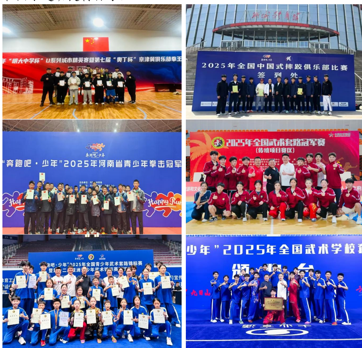
图 11 竞赛成绩

2025 年，鹅坡学子在全国各大赛事中屡获佳绩，斩获国家级金牌 15 枚，银牌 9 枚，铜牌 17 枚；省级金牌 78 枚，银牌 33 枚铜牌 53 枚。多名学员荣获国家二级运动员、国家一级运动员和国家运动健将称号。